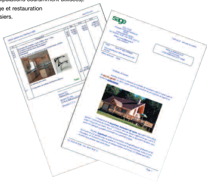
Des documents client personnalisés.

Pour plus d'informations : 0825 825 603 (0,15€ TTC/mn) ou www.sage.fr